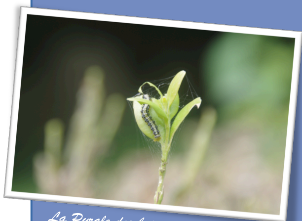
La Pyrale des buis