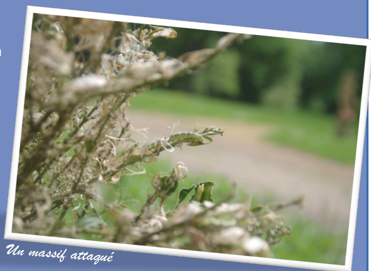
Un massif attaqué

Au plan national, d'autres recherches se poursuivent (« SaveBuxus 2014-2018 ») qui visent à trouver un biocontrôle naturel de ce phénomène.