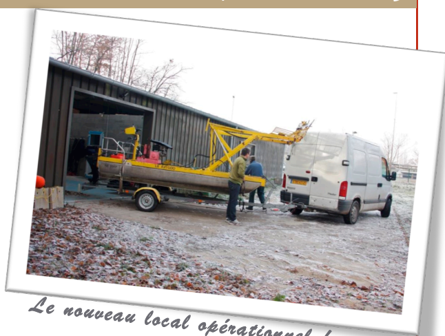
Le nouveau local opérationnel !