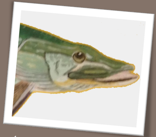
le torpilleur des eaux douces